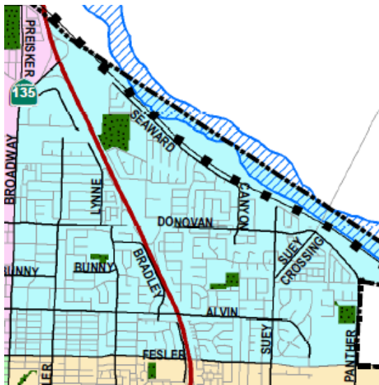
Los vecindarios de la parte Nordeste